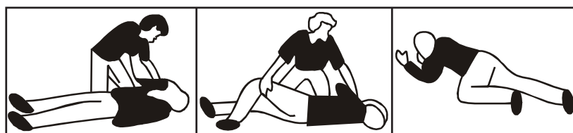
चित्र 1 : रिकवरी पोजीशन